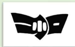
加茂小のシンボル

加茂小学校は昭和54年に開校し、今年43周年を迎えました。仙台市北部にあり、仙台駅から北へ向かって10km、八乙女交差点より西方3kmの加茂団地の中央に位置し、383名の児童が元気いっぱいに活動しています。校章には加茂の「加」を圖案化し、中央に「小」の字を配して、加茂小学校の飛躍的発展の姿を象徴しています。