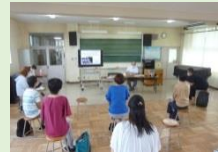
コミュニティスクール研修