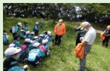
長命サポーターズさんを迎えて