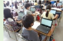
G I G A スクールに向けて