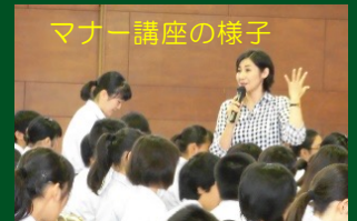
マナー講座の様子