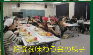
給食を味わう会の様子

*令和3年度はコロナウイルス感染症拡大防止対策により実施できなかった活動も掲載しています。