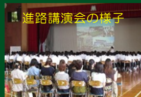
進路講演会の様子